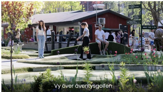
Vy över äventysgolfen