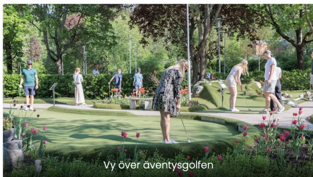
Vy över äventysgolfen