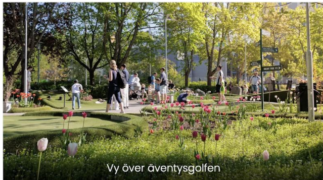
Vy över äventysgolfen

Vi har också skapat en ny företagsprofil hos Tripadvisor.